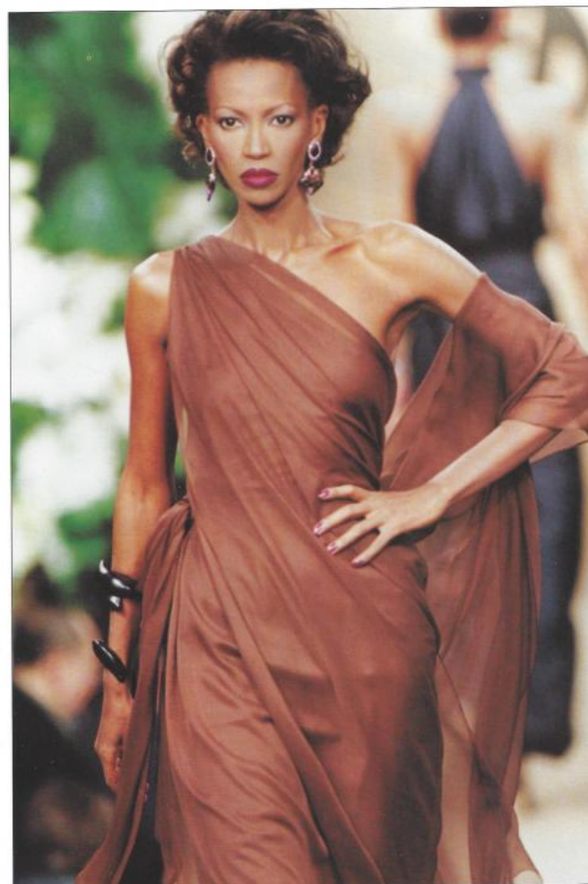
YVES SAINT LAURENT robe longue en mousseline savane CLERICI TESSUTO JOYCE PARIS mars / avril 1999 «87»