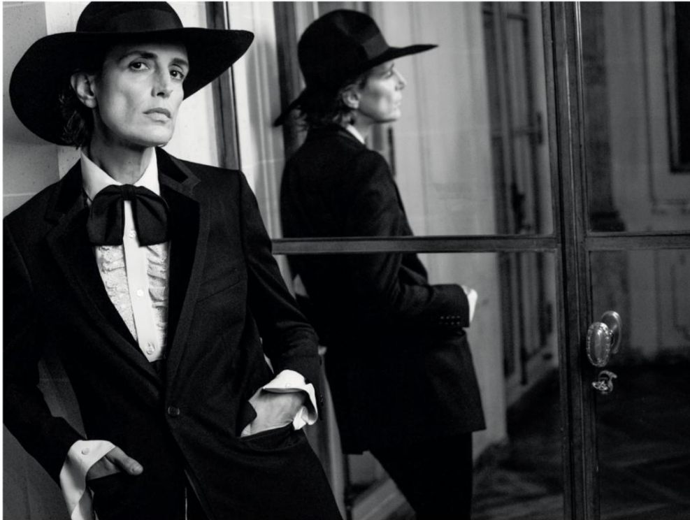
Veste en laine et mohair à col et revers de velours, gilet brodé, chemise en soie à jabot brodé, pantalon Dylan en velours et nœud papillon en soie, CELINE HOMME PAR HEDI SLIMANE. Chapeau, CELINE PAR HEDI SLIMANE.