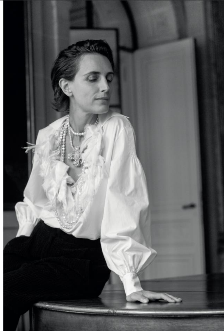
Blouse en popeline de coton à jabot de soie et coton coupé bord vif, pantalon en velours et bijoux, CHANEL .